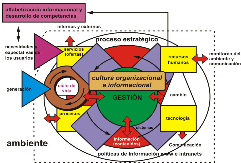
Figura 4. Modelo de Gestión de Información de Ponjuan (modificado de la versión original del 2000).

y dentro del propio sistema. Un componente vital constituye la interacción entre los recursos humanos del sistema y los usuarios, mediante acciones que eleven las competencias informacionales y la cultura de los mismos a partir de programas de alfabetización informacional. La cultura organizacional e informacional presente en el sistema, juega un papel vital en el comportamiento del trabajo informacional.