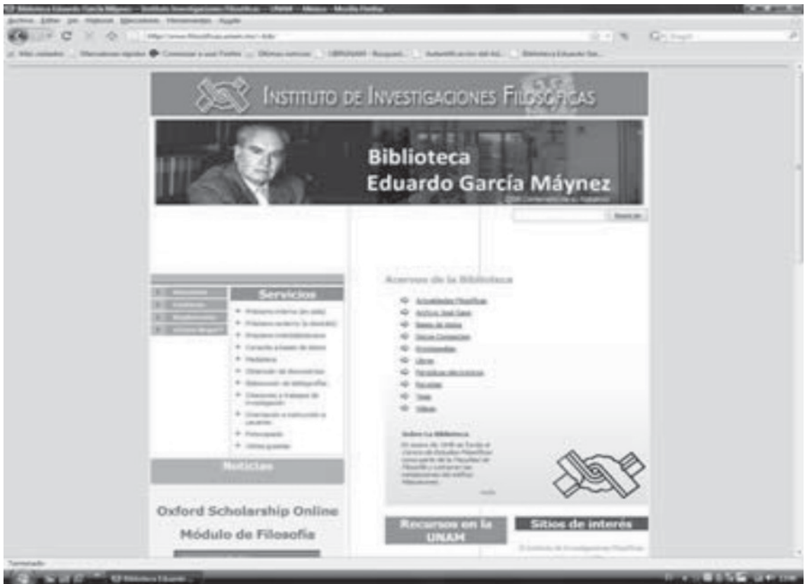
Fig. 1. Sitio de la biblioteca «Eduardo García Máynez»

Estudios Filosóficos* como parte de la Facultad de Filosofía y Letras en las instalaciones del edificio Mascarones, en la ciudad de México. Sin embargo, no fue hasta 1945 cuando se estableció la biblioteca del Centro de Estudios Filosóficos.