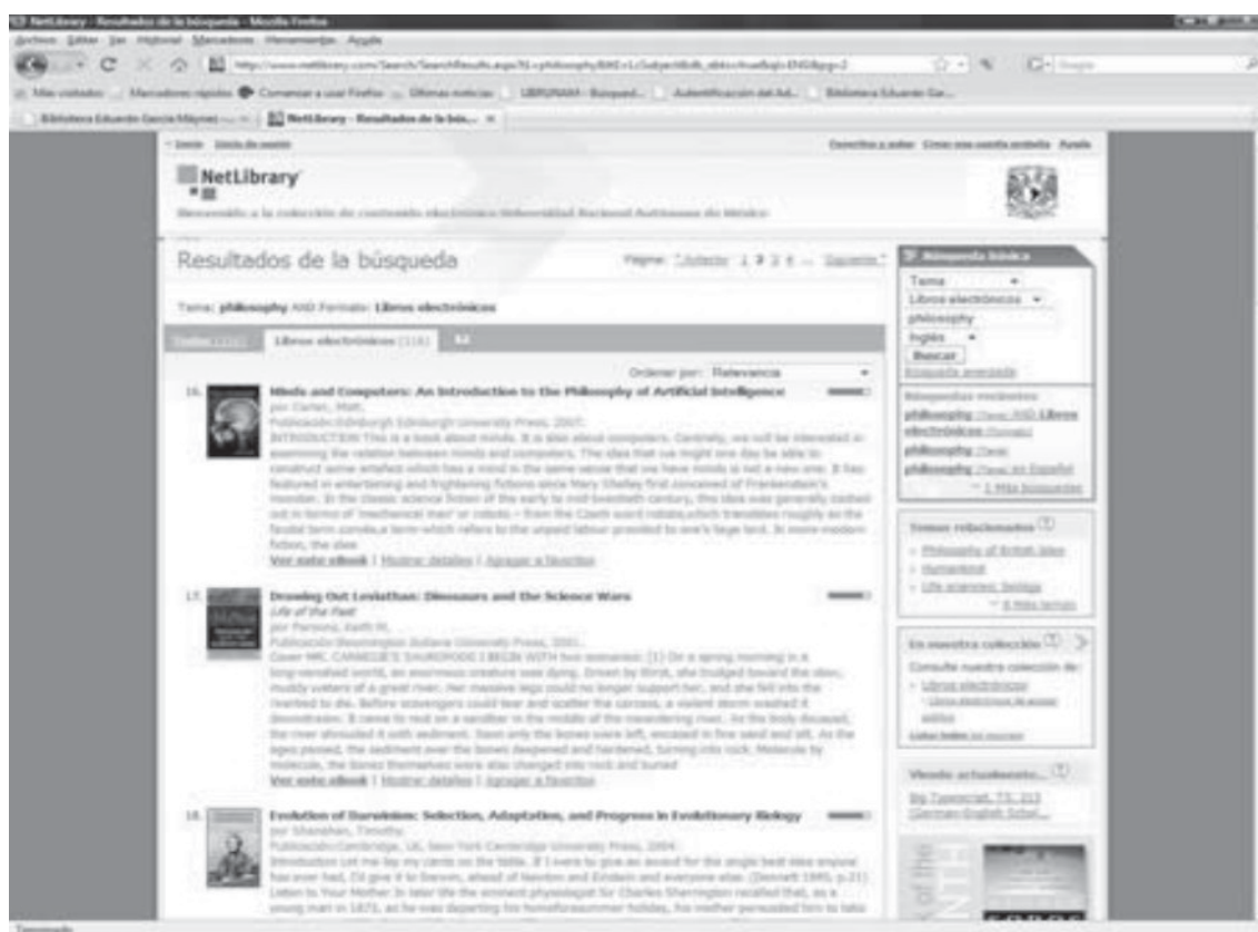
Fig. 2. Libros electrónicos de Netlibrary

En dicho proceso se revisaron más de 300 títulos especializados y se contó con la participación de dos investigadores del Instituto y dos profesionales de la bibliotecología, quienes revisaron minuciosamente los listados generados en cada una de las etapas, poniendo énfasis en datos relevantes como: títulos, autores, temas, editoriales y años de edición, entre otros; así como las líneas de investigación prevalentes en el Instituto. Finalmente fueron seleccionados 18 títulos en inglés, cuyos contenidos correspondían a la temática del proyecto de investigación que cubriría el costo de los mismos, es decir, gracias al apoyo y entusiasmo de los