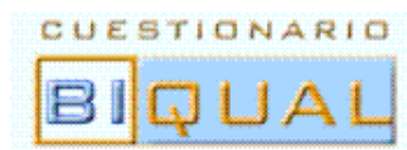
Figura 2 Cuestionario BiQual