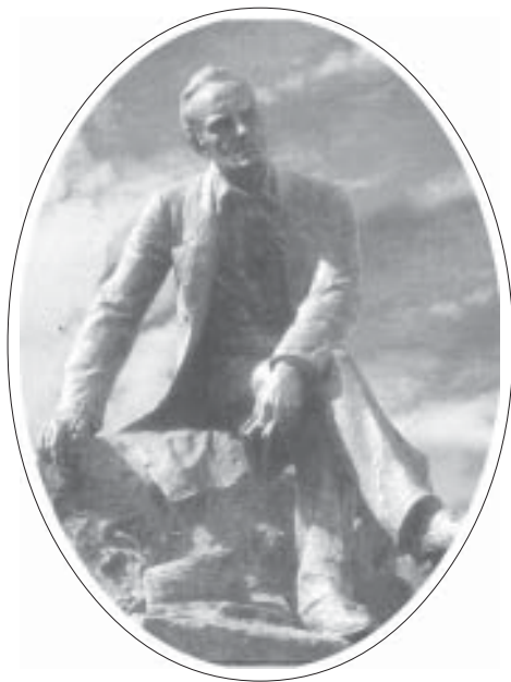
José de la Luz y Caballero (1800-1862)