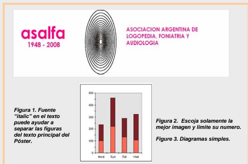
Figura 1. Fuente "italic" en el texto puede ayudar a separar las figuras del texto principal del Póster.

Usted también puede usar archivos animados pero usted por lo menos debe estar seguro que usted ofrece el software necesario para ver la animación para lo cual usted debe enviarla en el disco o puede que no reproduzca de manera adecuada.