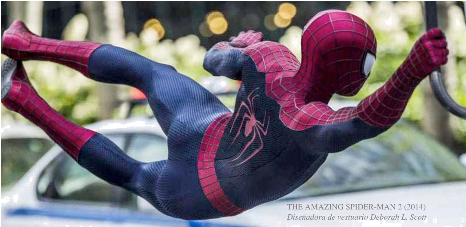
THE AMAZING SPIDER-MAN 2 (2014) Diseñadora de vestuario Deborah L. Scott