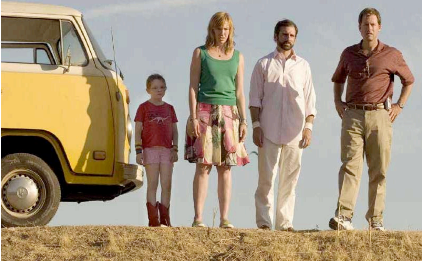
LITTLE MISS SUNSHINE (2006) Diseñadora de vestuario Nancy Steiner

El relleno puede darle a una actriz delgada una figura más desarrollada o un embarazo, y darle a un actor musculoso el aspecto de hombros estrechos y encorvados o una gran panza dependiendo de que personaje esté interpretando. Corsés, fajas y una variedad de ropa interior puede transformar a un actor en un género diferente.