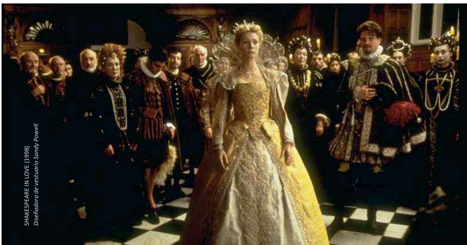
SHAKESPEARE IN LOVE (1998) Diseñadora de vestuario Sandy Powell

Muéstrele a sus alumnos una escena de una película. Pídale que describan cada uno de los personajes principales en la escena. ¿Qué sucedió en la escena?