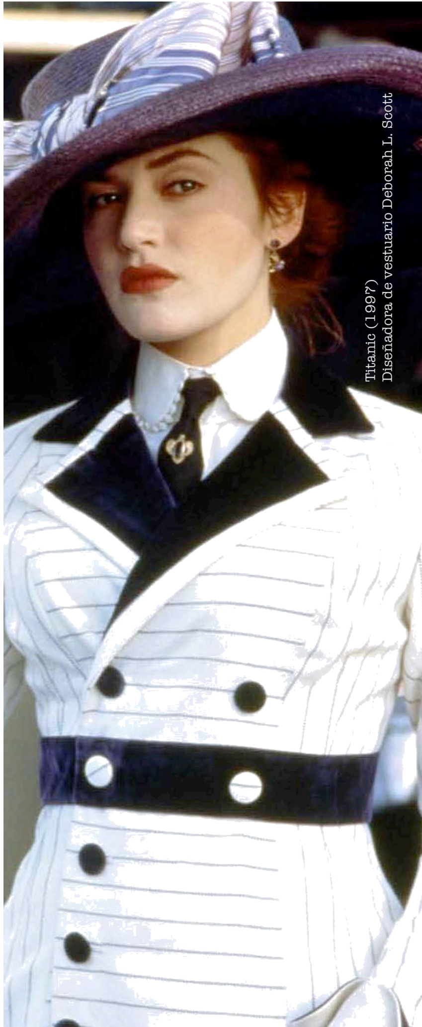
Titanic (1997) Diseñadora de vestuario Deborah L. Scott