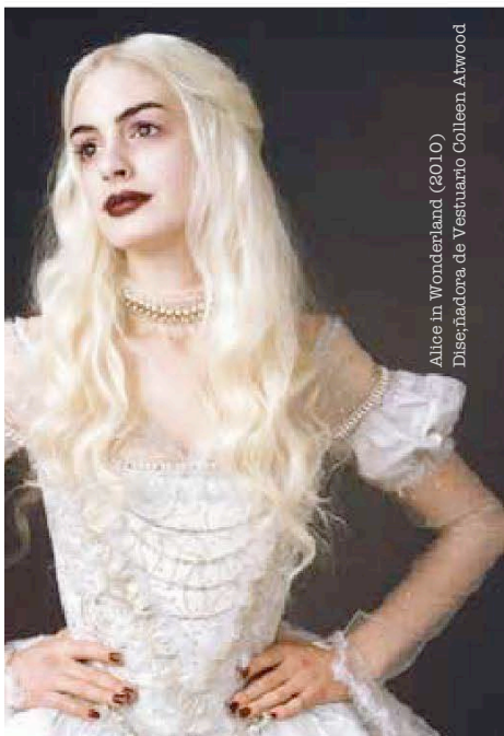
Alice in Wonderland (2010) Diseñadora de Vestuario Colleen Atwood