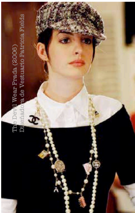
The Devil Wear Prada (2006) Diseñadora de Vestuario Patricia Fields