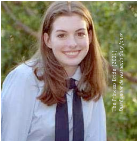
The Princess Bride (2001) Diseñador de vestuario Gary Jones

◀ El papel que representan los diseñadores de vestuario en la narración de una película se ve de mejor manera al examinar a la gente que los actores han representado durante sus carreras. Compare los tres diversos personajes interpretados por Anne Hathaway en The Princess Diaries (2001, vestuario diseñado por Gary Jones), The Devil Wear Prada (2006, vestuario diseñado por Patricia Field), y Alice in Wonderland (2010, vestuario diseñado por Colleen Atwood).