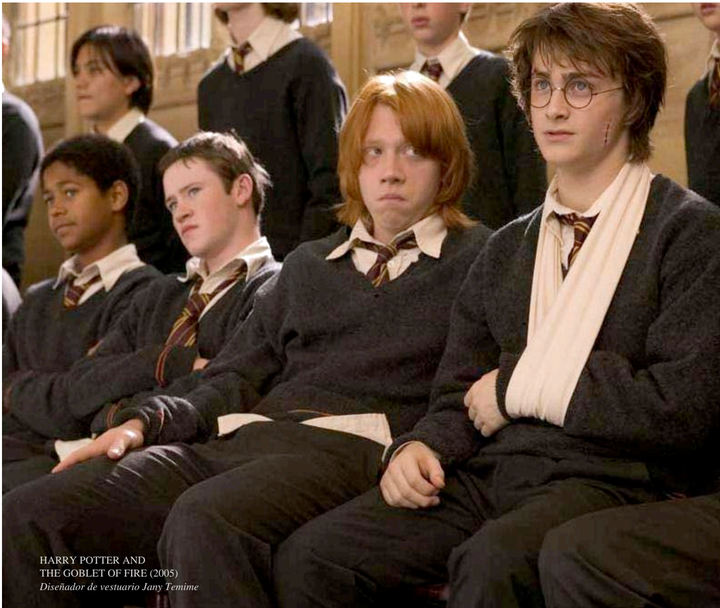
HARRY POTTER AND THE GOBLET OF FIRE (2005) Diseñador de vestuario Jany Temime