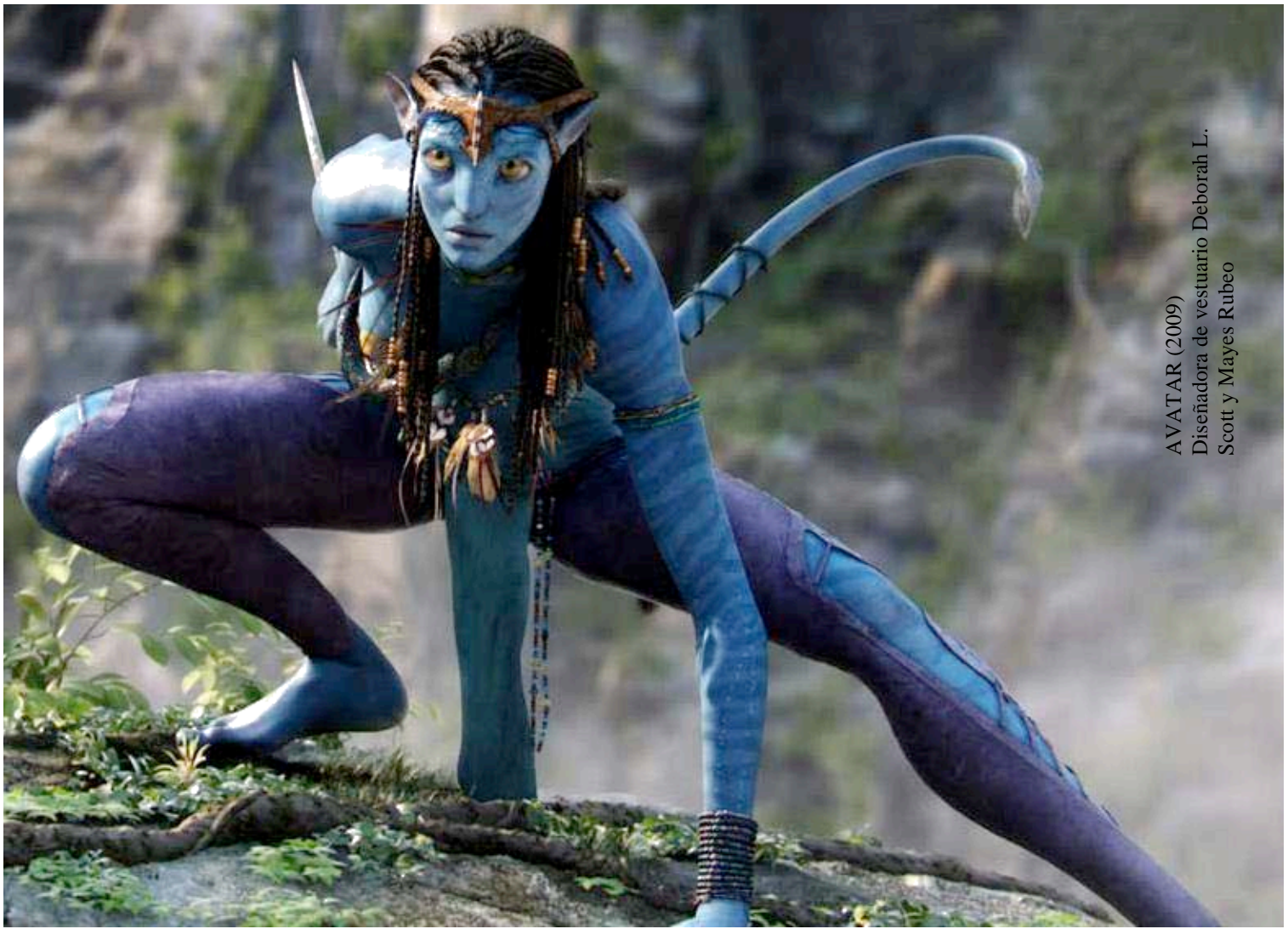
AVATAR (2009) Diseñadora de vestuario Deborah L. Scott y Mayes Rubeo