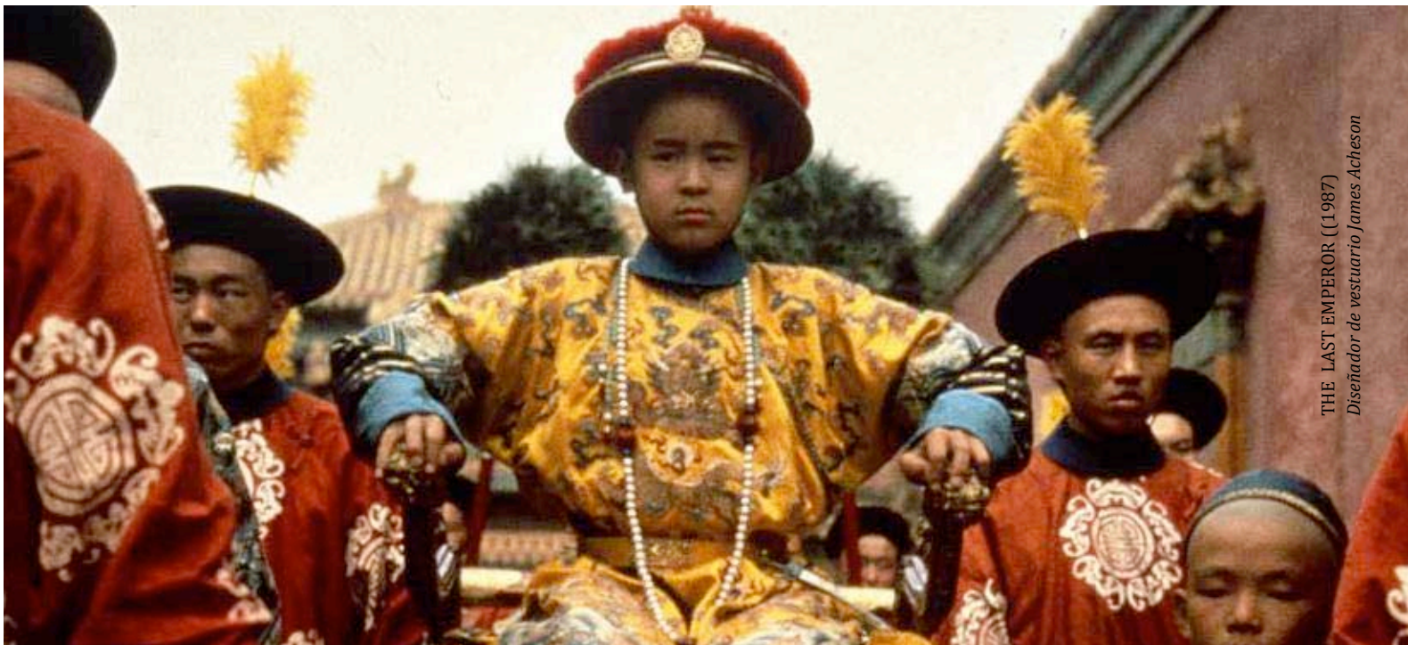
THE LAST EMPEROR ((1987) Diseñador de vestuario James Acheson

¿Qué manifiesta este artículo sobre usted? _____