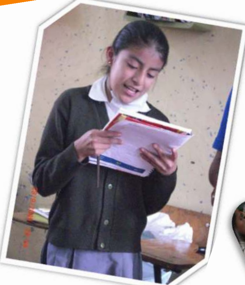
Momentos al compartir la Bitácora Material de Puebla, Puebla