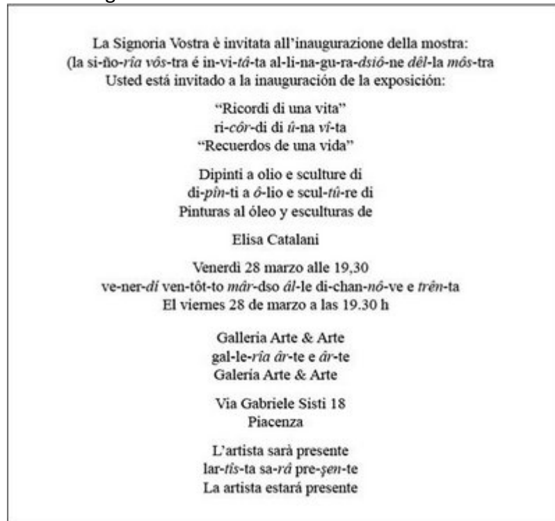
Figura 7-2: La clásica invitación impresa formal

La figura 7-2 es un ejemplo de una invitación formal a la inauguración de una exposición de la artista Elisa Catalani en una galería de arte en la ciudad de Piacenza.