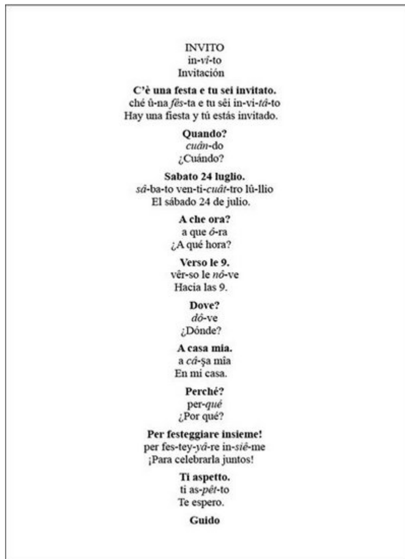
Figura 7-1: Una invitación informal que se puede enviar por fax