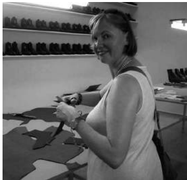
Carlos Amorales, Flames Maquiladora , 2001-02.

En la Bienal anterior, 2003, el mexicano Carlos Amorales presentaba en el pabellón holandés su obra Maquiladora : hileras de zapatos idénticos expuestos y la posibilidad de que el visitante participara en las distintas fases de su fabricación; el espectador de la más reconocida convención de arte contemporáneo puede jugar en el primer mundo a crear zapatos de arte maquilados y mediante una experiencia estetizada acercarse a la realidad laboral del tercer mundo.