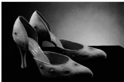
Nicola Constantino, Peletería con piel humana , 2000.

los haya. Como comenta Jorge Anaya López “la unión de la moda y la muerte parece tener connotaciones cónicas”, 11 y una vez más nos sentimos incómodos en estos zapatos que ofrecen el juego ambiguo de insinuar denuncias de explotación y comodificación del arte y el cuerpo, a la par de refinar perversamente el zapato de tacón femenino como objeto por antonomasia del fetichismo de la mercancía.