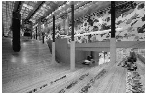
Epicentro Prada, Soho, New York.

El momento contemporáneo de esa fase avanzada del capitalismo sería, en términos de José Luis Brea, el umbral por el que transitamos a un tercer estado, el del capitalismo cultural , asistiendo a la espectacularización de las prácticas culturales paralela a la agresiva y obscena estetización de las mercancías, en el largo camino recorrido desde aquellos pasajes comerciales de la burguesía parisina del siglo XIX, a partir de cuyas mercancías en exhibición Walter Benjamin definió el espectáculo de París como fantasmagoría.