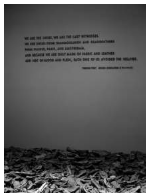
We are the shoes, we are the witnesses... United States Holocaust Memorial Museum, Washington D. C.

exceso sólo se expresa mediante la ausencia. En cambio, siguiendo su argumentación, estamos en estos momentos experimentando una fase de extenuación de la imagen: ceguera del espectador por sobreexposición.