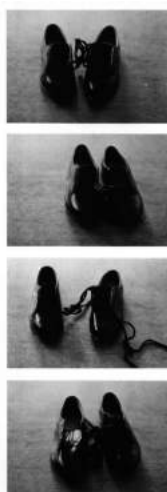
Sherrie Levine, Shoe Sale at Mercer Street Store , New York, 1977.

Habría que establecer una diferencia entre esta dudosa potencialidad crítica de un cinismo estético, o cinismo melancólico, en palabras de Mario Perniola, y otras apropiaciones, como las de Sherrie Levine, quien antes de empezar a refotografiar fotografías de artistas consagrados, compró en un bazar una caja de setenta y cinco pares de serios zapatos de cordones de talla infantil y los puso a la venta en Nueva York a precios mínimos en 1977 como performance . En ya ortodoxa práctica de transformación del objeto encontrado, los zapatos apropiados por Levine, comprados, vendidos y fetichizados han visto su valor de uso impregnado de la mística de la mercancía y se convierten en objeto de deseo de consumo; pero, sin embargo, en las instantáneas que se conservan de aquella venta Andrea Kroksnes ve zapatos robados a Van Gogh, y Douglas Crimp ante la visión de aquellos zapatos amontonados en una mesa confesaba que se sintió tentado a “darles vida, inventar historias en las que se convirtieran en personajes por sinécdoque”: 6 los zapatos vacíos parecen invitar a completar una narrativa, a ser reintegrados a alguien, cuestión planteada por Derrida precisamente en “Resituciones”.