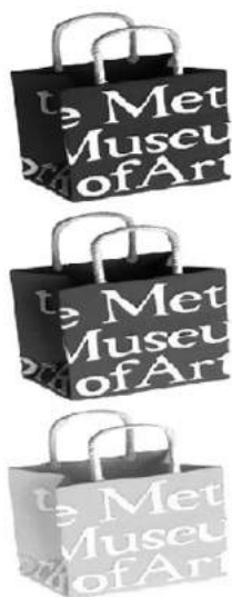
Bolsa de compras característica del Museum Metropolitan of Art de Nueva York.

El caso del MET, Museum Metropolitan of Art, es distinto. Ofrece una menor variedad de artilugios en su tienda aunque sí son más ricos, desde el punto de vista artístico, la selección de los mismos, pues los contenidos artísticos de este museo son más amplios en el tiempo y no se restringen a obras contemporáneas como ocurría en su vecino MOMA.