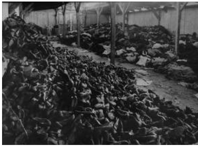
Zapatos y ropa en Auschwitz.

El texto de Derrida se hilvana a partir de las relaciones entre el hecho, por una parte, de que en “El origen de la obra de arte” Heidegger asumiera que los famosos zapatos pintados por Van Gogh de los que trata en su texto pertenecían a una campesina, y por otra, la simbólica devolución que Meyer Schapiro hace de los zapatos en un texto de 1968, dedicado a Kurt Goldstein, huido de la Alemania nazi en 1933, argumentando que los zapatos en cuestión eran los propios zapatos de Van Gogh. Derrida va desatando en su texto una narrativa de restitución, como si Schapiro le disputara los zapatos a Heidegger, se los pasara a Van Gogh en París y finalmente a Goldstein en Nueva York como homenaje tras su larga marcha desde Alemania: “hay mucho para pagar, para devolver, para restituir, cuando no para expiar, en todo esto”, escribe Derrida. 7