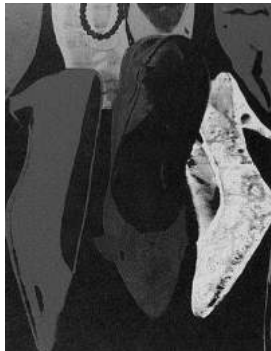
Andy Warhol, Zapatos de polvo de diamante , 1980.

Si seguimos sirviéndonos de los mismos zapatos, podríamos sintetizar las características ya canónicas para diferenciar o oponer modernismo y posmodernismo de modo que la interpretación a partir de un modelo de profundidad, originalidad, metáfora y en resumen, presencia de una subjetividad genial quedan atados a los viejos zapatos o botas de Van Gogh, mientras los planos zapatos de