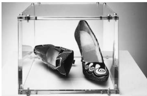
Yinka Shonibare, Cha Cha Cha , 1997.

¿Los escaparates se han hecho más grandes que el arte?