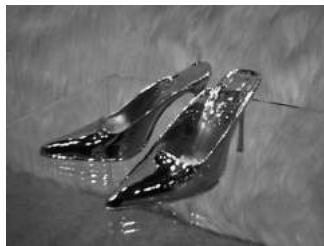
Sylvie Fleury, Gucci , 1988.

Desde la comparación entre el aura cálida de los vividos zapatos de Van Gogh y las auras frías, en términos de Brea, de los zapatos de polvo de diamante de Warhol, otros muchos zapatos han buscado dejar su huella en la trayectoria de las prácticas artísticas contemporáneas, como la helada réplica en aluminio de unas sandalias Gucci de la suiza Sylvie Fleury en la más fría posmodernidad. Si Jameson lamentaba –o quizá sólo exageraba para plantear su premisa– que los zapatos de Warhol no tuvieran nada que decir, la incomodidad de este par metálico cansa en su repetido parloteo que dejó ya muy atrás la ironía y que se muestra con el cínico desparpajo del que sabe lo que está haciendo y lo hace desde la complacencia del fetichismo virginal del escaparate.