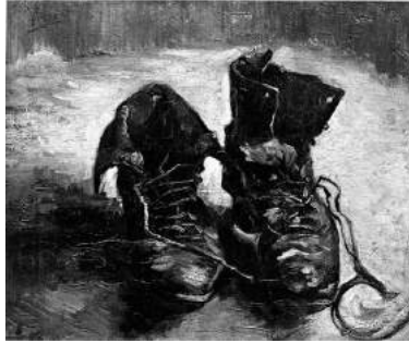
Vincent Van Gogh, Viejos zapatos con cordones , 1886.

por otro, los Zapatos de polvo de diamante de Andy Warhol, que, por si no quedara suficientemente clara su indiferencia hacia ellos, Jameson describía como “colección aleatoria de objetos sin vida reunidos en el lienzo como un manajo de hortalizas.” 3