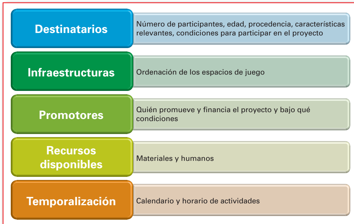
Figura 1. Aspectos organizativos de la programación.

Hemos de tener en cuenta una serie de aspectos organizativos a la hora de programar (Figura 1).