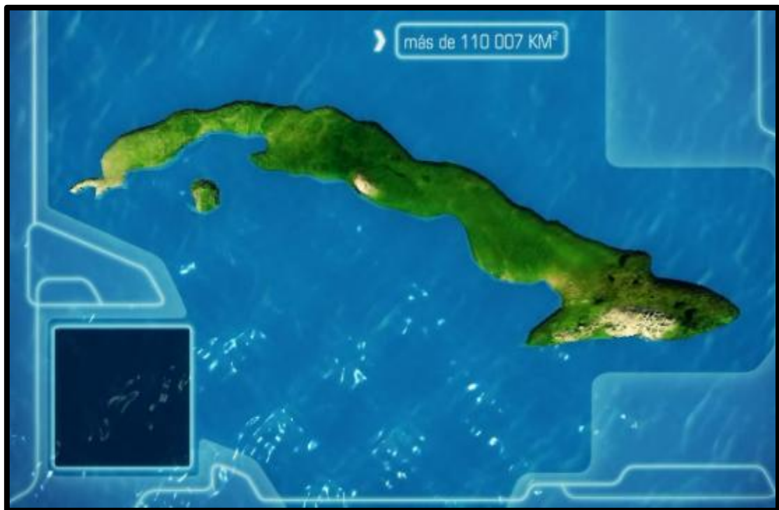
Video Cuba como un objetivo estratégico en la geopolítica

Estos materiales se han entregado a varios centros de educación superior que se han interesado por ellos para su uso.