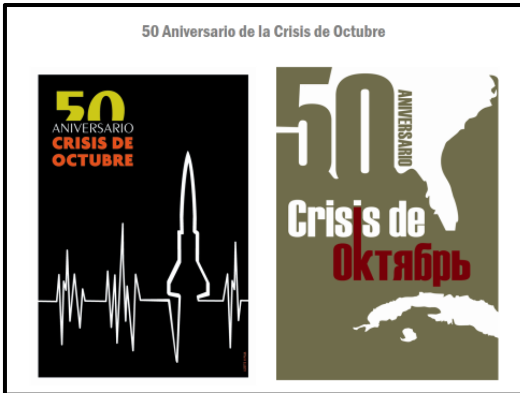
Carteles por el 50 aniversario de la Crisis de Octubre

También hemos desarrollado algunas campañas de divulgación y homenaje a determinados hechos históricos, como las siguientes: