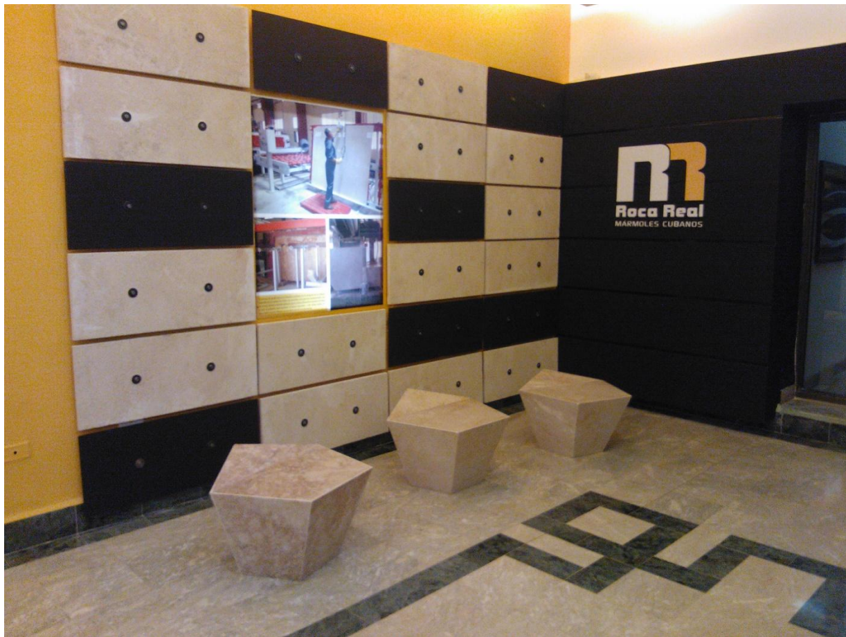
JUGUETERÍA / HOTEL HABANA LIBRE_ ENERO 2015