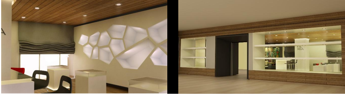
STAND COECA_ NOVIEMBRE 2014