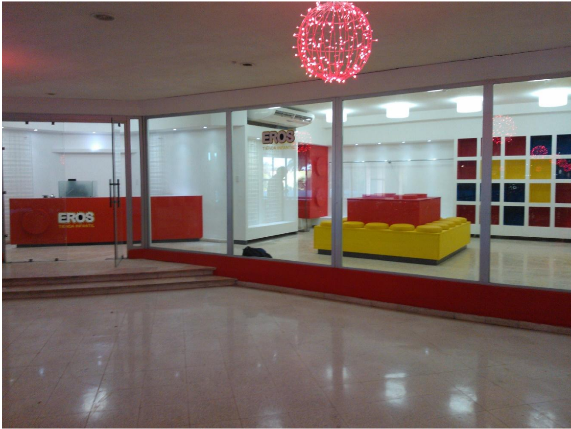
JOYERIA SOUVENIR / HOTEL PARQUE CENTRAL_ENERO 2015