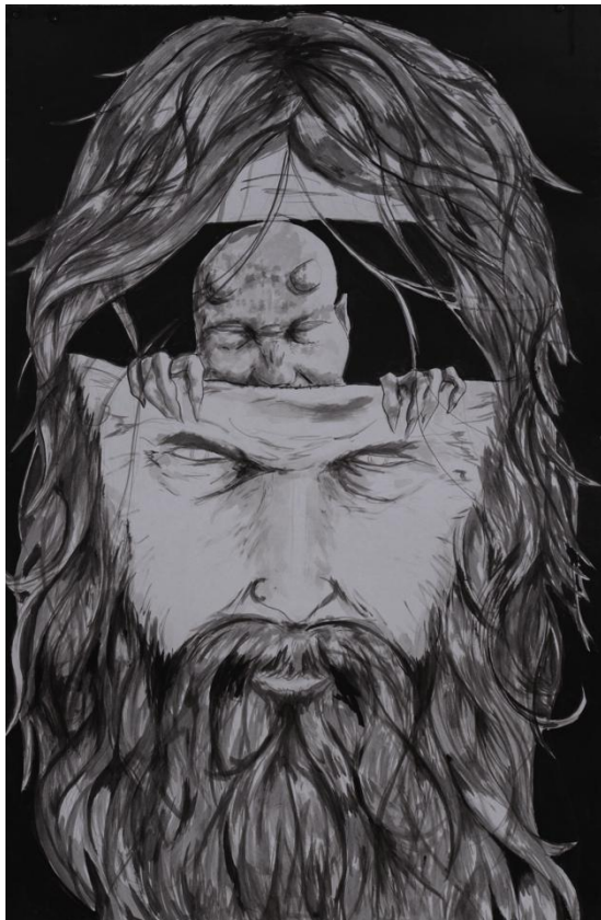
Foto 2: “El diablo no existe”. Técnica: Acrílico y tinta china. Autor: Pher Galvan Torres, 2014. Si no hay un lugar para los pecadores y tampoco hay un ser que los castigue ¿Quién es el encargado de juzgar estas acciones y como o lo va hacer?

En la cultura de México, el ocultismo esta impregnado en la sociedad. Con el paso del tiempo se han desarrollado rituales que tienen sus raíces en alguna antigua práctica que se relaciona con lo mágico. Tiene relación con la necesidad del mexicano de obtener lo que desea y que, de cierta manera, no es fácil de conseguir. Por esta razón los mexicanos, como parte de la cultura, en algún momento buscan