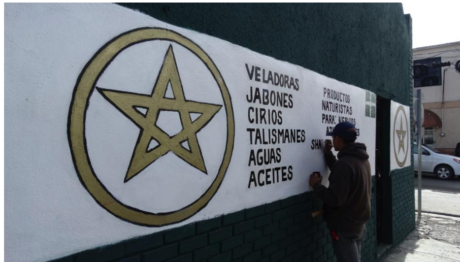
Foto 4: Foto 4: Servicios esotéricos ofrecidos en el establecimiento. Imagen obtenida en la ciudad de Saltillo Coahuila por J.C.S.

existe el misterio de lo que se distribuye en estas tiendas. Sin embargo existe la idea de que distribuyen productos de origen natural, lo que hace que sean mas valoradas por sus clientes.