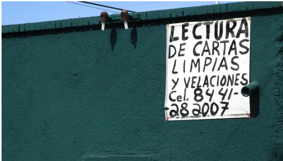
Foto 3: Los servicios esotéricos se anuncian en las calles de la ciudad. Imagen obtenida en la ciudad de Saltillo Coahuila por J.C.S.

En la actualidad, el esoterismo juega un papel importante en la sociedad y no hace diferencia entre clases sociales. Se realizan convenciones sobre el tema al que acuden todo tipo de personas en varias entidades del país como el Distrito Federal, Monterrey y Espinazo, en Nuevo León; Catemaco y Veracruz. En la mayoría de las poblaciones encontramos establecimientos en donde se comercializan los servicios de lo esotérico en sus diferentes vertientes, desde los amarres, las barridas o limpiezas, la cartomancia o lectura de cartas, hechizos y remedios milagrosos, por mencionar algunos.