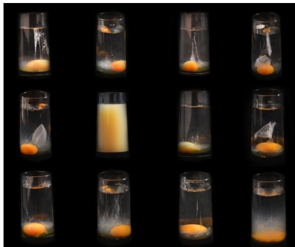
Foto 5: “Maldiojo”. Autor: Nathalie Pineda, 2014. La pieza consta en usar 12 huevos de gallina, y las personas involucradas puedan hacerse una Auto-Limpia por un minuto de tiempo, usando su propio calor corporal.

cual se cree que posee cualidades para limpiar el espacio de vibras negativas; en otros rituales se utiliza el alcohol en las palmas, nuca, espalda, y otras partes del cuerpo del paciente a tratar; también se utiliza la frotada del huevo por todo el cuerpo. Lo que no cambia en estos rituales es la forma de la interpretación, ya que el objeto de interpretación es la yema del huevo y su comportamiento con el elemento del agua, dependiendo de las formas que adopte se puede diagnosticar una enfermedad y por consiguiente recomendar un tratamiento dependiendo de que tan grave sea el embrujo o mal. Puede requerir más de una limpia, entre más turbio sea el huevo en el agua mayor es la gravedad del paciente. Se interpretan las formas y los colores para determinar el padecimiento, si es de color verde o rojo quiere decir que el mal es grande y se debe de continuar con el tratamiento, inclusive tiene relación el color de la gallina de la que se escogen los huevos. Las gallinas negras representan a la oscuridad con lo que se trata de segar el mal de ojo (Universidad Nacional Autónoma de México, 2009).