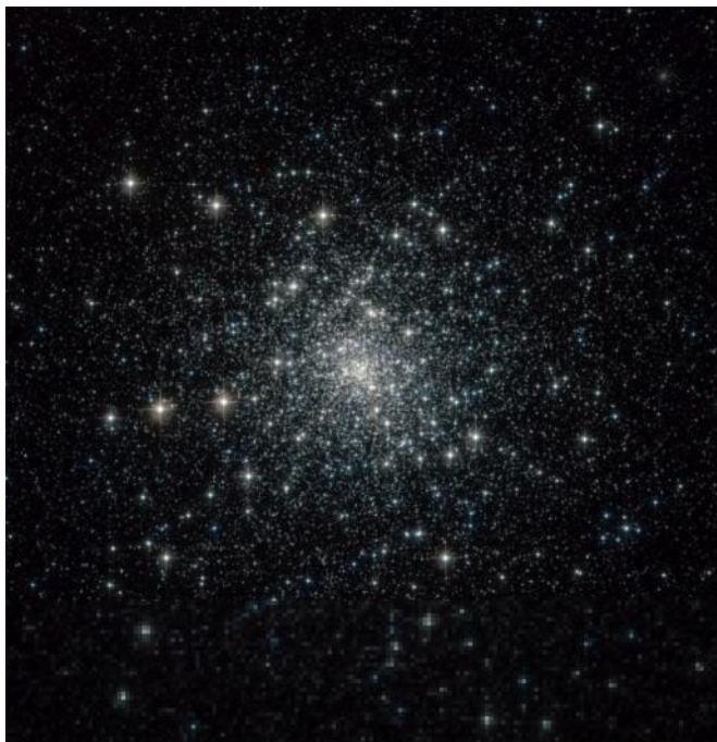
Figura 2: Messier 30 (NGC 7099) registrado por telescopio espacial Hubble, NASA.

Fuente: Disponible en http://www.constellation-guide.com/constellation-list/capricornus-constellation/messier-30-ngc-7099/ Accedido en 10/02/2015.