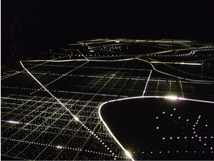
Figura 3: Acerca de Cómo la Tierra Quiere Parecerse al Cielo, de Carlos Garaicoa.