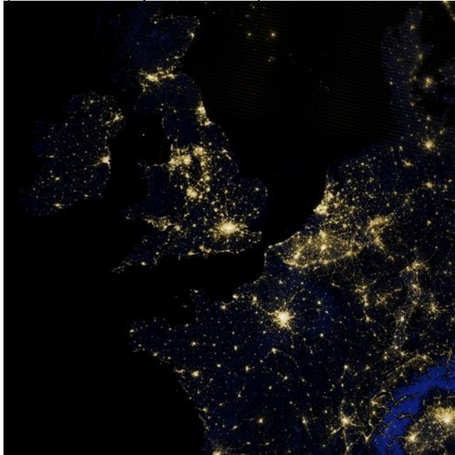
Figura 1: Islas británicas, París y sus alrededores capturadas por medio de satélite ISS ( International Space Station ) de la NASA.