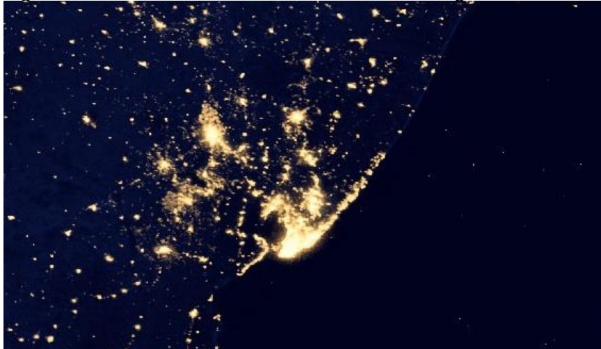
Figura 5: Ciudad de Salvador-Bahía-Brasil en imagen de satélite de NASA.