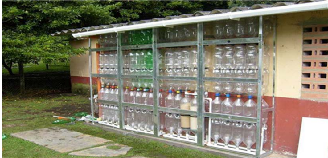
Ilustración 3. Fotografía del Proyecto Ekomuro H2O+. Autora: Jessica Alba. 2016.

Ekomuro H2O+ es un proyecto innovador que desarrolla un sistema de recolección de agua lluvia elaborado modularmente, el cual reutiliza 54 botellas PET de 3 o 2.5 litros, que, interconectados entre sí, conforman un depósito de agua tipo vertical, orientado a satisfacer las necesidades de ahorro de agua en una vivienda urbana. Desde su creación, el proyecto ha sido replicado en distintos colegios y universidades de la ciudad de Bogotá. En 2016 el proyecto recibió el primer premio en el Séptimo Foro Mundial del Agua, celebrado en Corea del Sur (Alba, 2016). Estas son algunas de las etapas del proceso creativo: