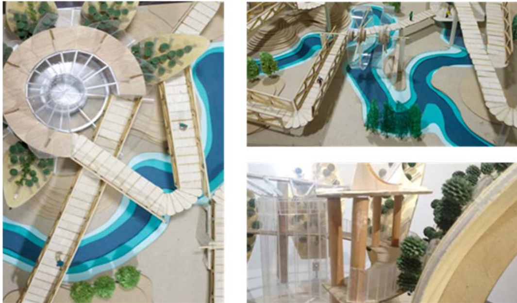
Ilustración 1. Fotografías de los modelos del Proyecto Moviterra. Autora: Diana Valbuena. 2016.

Moviterra es un proyecto escenográfico que propone un centro interactivo para los visitantes de los senderos de los cerros orientales de la ciudad de Bogotá. De igual manera, el proyecto plantea una intervención de la quebrada “Puente Piedra”, aplicando los principios de sostenibilidad y la creación de espacios incluyentes para la comunidad de la zona (Valbuena, 2016). Estas son algunas de las etapas del proceso creativo: