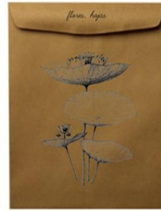
Sobre para hojas y flores