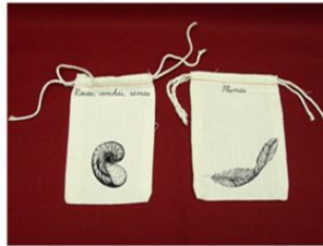
bolsitas para guardar