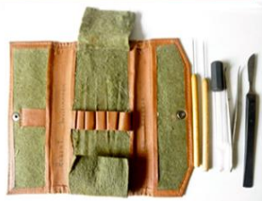
Herramientas, pinta, tijeras, lápices