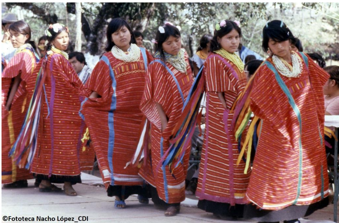
Figura 2.-Comisión Nacional para el Desarrollo de los Pueblos Indígenas (2013)

4.- Generar. Reuniéndose el equipo que realizó la visita de campo con el equipo de diseño, se trasmite y se muestra toda la información, haciendo hincapié en que el rediseño debe de preservar su identidad, donde puedan proseguir con la tradición del bordado artesanal.