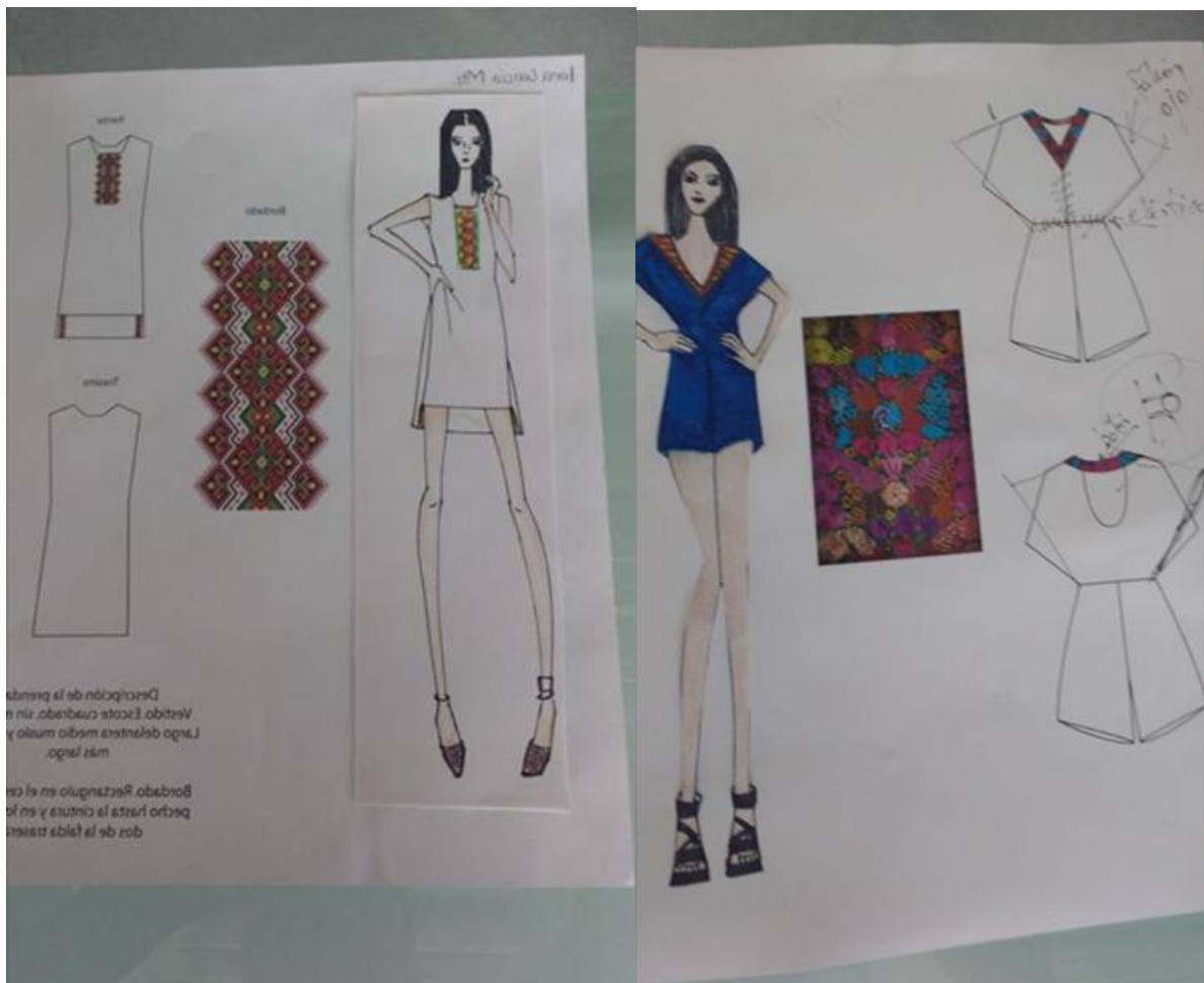
Figura 3.-Diseños realizados por los alumnos de la Lic. en Diseño de Moda, para el proyecto Unnarikum, (2016)

Muestras talla M, realizadas en manta (tela 100%de algodón) por los alumnos, para que las mujeres purépechas, las puedan bordar con su bordado tradicional.