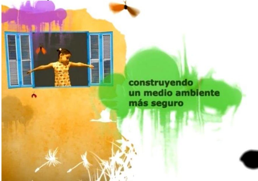
Spot sobre la protección del Medio Ambiente.