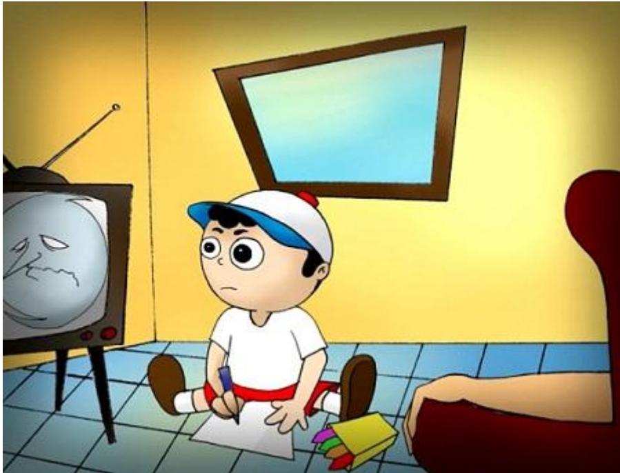
Spot sobre los Ciclones.