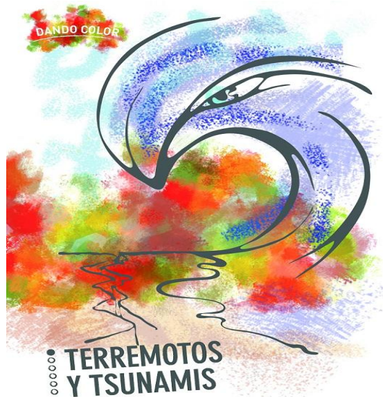
Libro de colorear