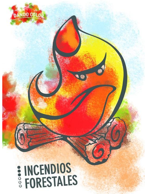
Libro de colorear