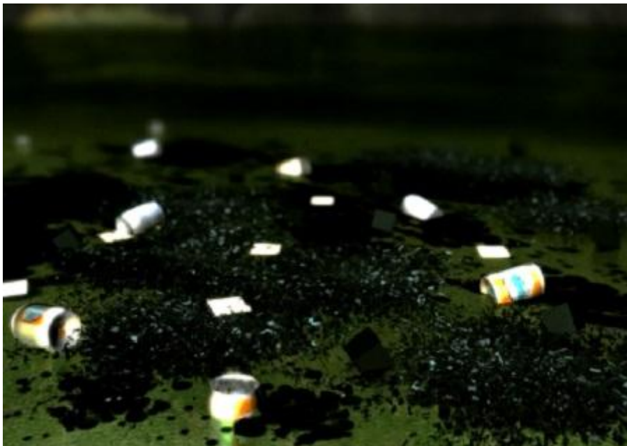
Spot sobre aguas contaminadas.