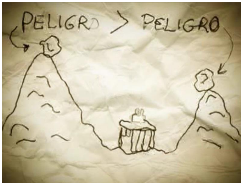
Spot sobre los derrumbes y deslizamientos