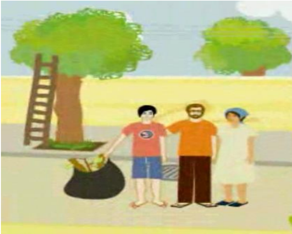
Spot sobre los adolescentes ante los desastres.