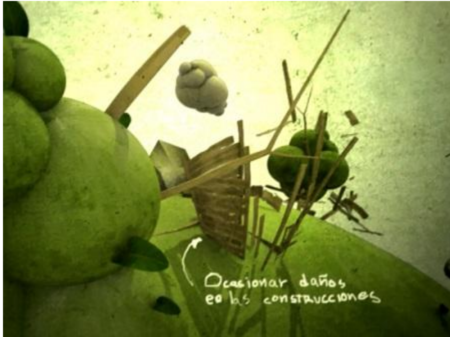
Spot sobre Terremotos