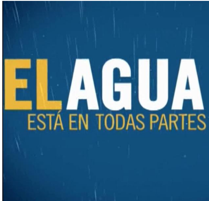
Spot sobre aguas contaminadas